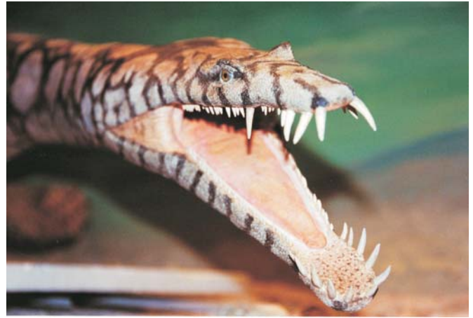
Abb. 2: Nothosaurus mirabilis -Modell (Muschelkalk).