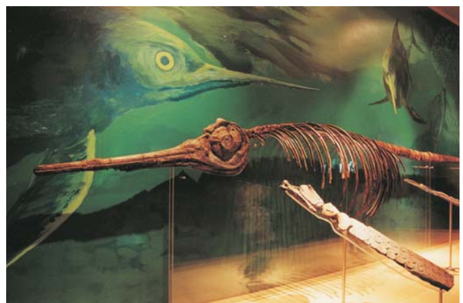
Abb. 4: Fischeosaurier Eurhinosaurus longirostris aus dem Posidonienschiefer, Lias von Schandelah.