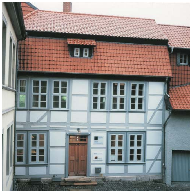
Abb. 1: Geopark-Infozentrum Königsutter, Bauteil "Barockgebäude" (Foto: S. Röber).

Topogr. Karte 1 : 25.000, Blatt 3720 Königsutter, Geol. Karte 1 : 25.000, Blatt 3730 Königsutter, Topogr. Karte 1:50.000, Blatt L 3730 Königsutter am Elm, Geologische Wanderkarte 1:100.000 Braunschweiger Land, Geol. Übersichtskarte 1 : 200.000, Blatt CC 3926 Braunschweig