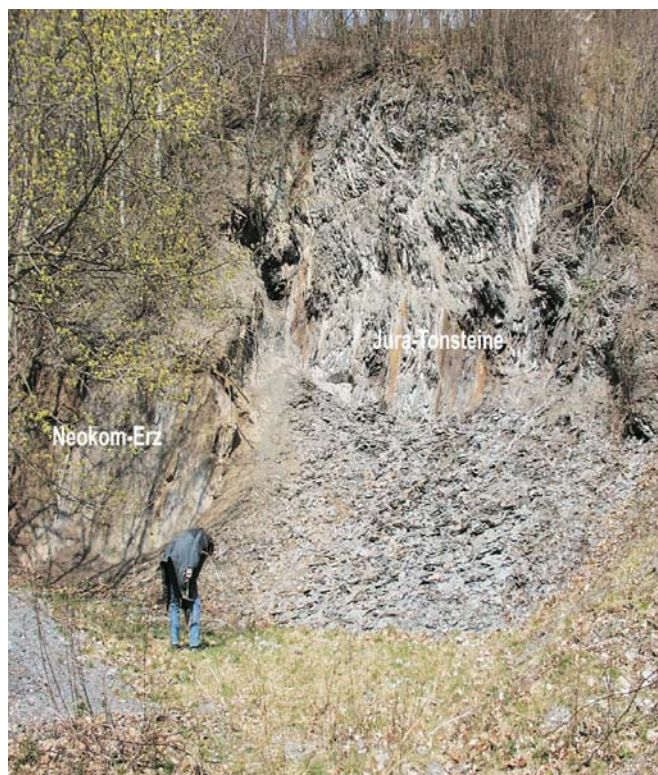
Abb. 1: Aufschluss im aufgelassenen Tagebau Glockenberg